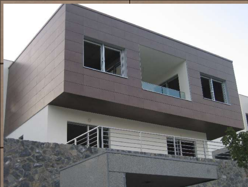
sl.4 Vjetrena keramička fasada sa pločama 100x50x1,3cm