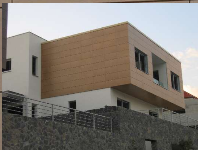
sl.2 VMD vile keramičke fasade Babonićeva, Zagreb

Tri nove vile u Babonićevoj ulici, Zagreb obložene su velikoformatnim keramičkim pločama dim. 120X60 i 100x50 cm. Montaža ploča 120x60 je izvedena na jednoj villi sa vidljivim kopčama na BWM potkonstrukciji tip ATK 100KL, a montaža ploča na druge dvije vile je izvedena sistemom BWM nevidljivih kopči tip ATK 102 Minor.