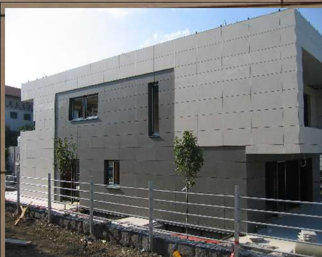
sl.3 Vjetrena keramička fasada sa pločama 120x60cm sistem ATK 100 KL

Sistem ATK 102 Minor nevidljivih kopči je moguć samo sa keramičkim pločama debljine iznad 12mm.